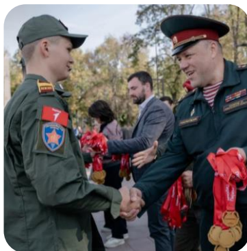
ВОЕННО-ПАТРИОТИЧЕСКАЯ ИГРА «ЗАРНИЦА 2.0»