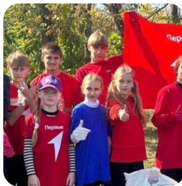
ВСЕРОССИЙСКИЙ ПРОЕКТ «БЛАГО ТВОРИ»