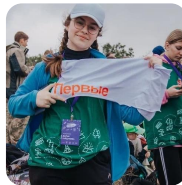
ПОХОДНОЕ ДВИЖЕНИЕ ПЕРВЫХ