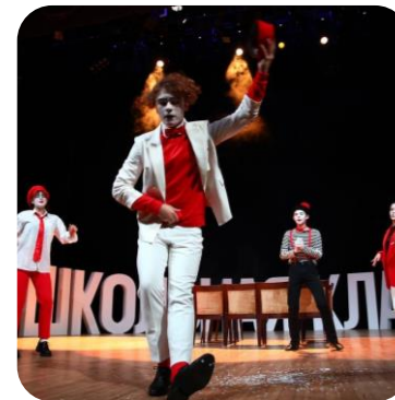
ВСЕРОССИЙСКИЙ ПРОЕКТ «ШКОЛЬНАЯ КЛАССИКА»