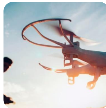
ВСЕРОССИЙСКИЙ ЧЕМПИОНАТ ПИЛОТИРОВАНИЯ ДРОНОВ «ПИЛОТЫ БУДУЩЕГО»