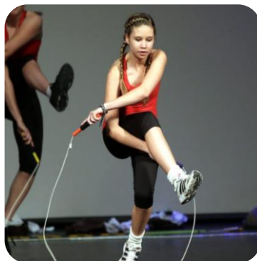
ВСЕРОССИЙСКИЙ ПРОЕКТ «ВЫЗОВ ПЕРВЫХ»