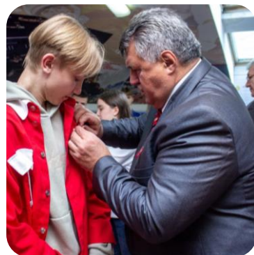
ВСЕРОССИЙСКИЙ ПРОЕКТ «ХРАНИТЕЛИ ИСТОРИИ»