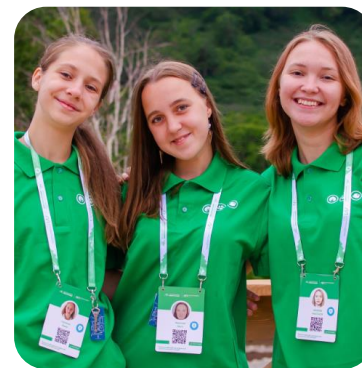
ВСЕРОССИЙСКИЙ ПРОЕКТ «ЮННАТЫ ПЕРВЫХ»