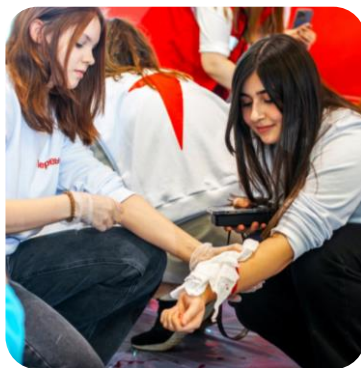
ВСЕРОССИЙСКИЙ ПРОЕКТ «ПЕРВАЯ ПОМОЩЬ»