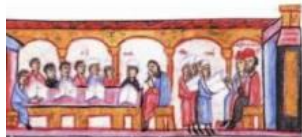
гола в Византии. Миниатюра

...человек изучению химии. был изобретен «греческий огонь» — зажигательная смесь из нефти и смолы, которую нельзя погасить водой. С помощью «греческого огня» византийцы одержали немало побед в сражениях на море и на суше. Византийцы накопили много знаний по географии. Они умели чертить карты и планы городов. Купцы и путешест-