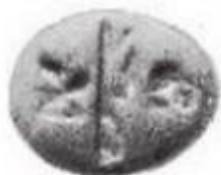
Лидийская монета. VII (7-й) век до н. э.

В западной части полуострова Малая Азия располагалась Лидийское царство . На песчаных берегах рек Малой Азии можно было найти крупинцы золота — песок здесь золотиносный. Именно в Лидии в VII (7-м) веке до н. э. начали чеканить первую в мире монету из сплава золота с серебром. Богатство лидийского царя Крёза вошло в поговорку.